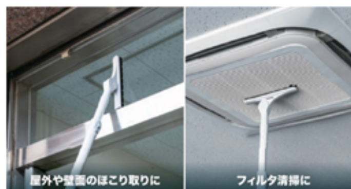
屋外や壁面のほこり取りに