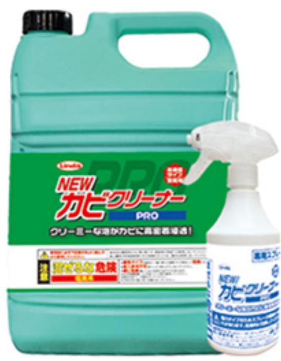
NEW カビクリーナー PRO 45kg

【NEWカビクリーナーPRO】は有効成分を高濃度に配合することで、従来品を上回る即効性を実現し、カビに対する強力な除去効果が得られ、スピード洗浄が可能になります。