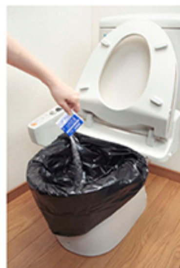
防災用トイレ袋使用方法

基本的な使用方法としては先程ご紹介させていただきました「R-39 非常用簡易トイレ」にも付属されており、汚物袋と凝固剤がなくなってしまう際に、こちらの商品で補充いただくために使ってくださいと思っております。また、その他の使用方法として、ご自宅が断水でトイレが流せない状況になった際には、トイレに汚物袋を被せていただき、用を足した後に凝固剤で固めていただければ断水時でもトイレを使用することが可能となります。排泄後の汚物袋に関しては、縛っていたり、地域で分別に従って処理いただければと思います。さらにはバケツがあれば、その上に汚物袋を被せて用を足すこともできますので、組み立て式のトイレだけではなく、こちらの商品も合わせてご自宅に備蓄いただければと思います。1人が一日におおよそ5回トイレを行うと考えると二週間で約35個は最低