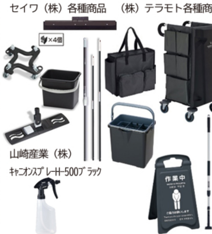
山崎産業(株) 社コオスプレH-500ブラック

少し前までは、黒色（ブラック）は他の色（赤・青・緑など）に比べて材料費が高価であったようですが、最近では商品化しやすい価格となつているようです。また、お客様から建築物や施設の雰囲気と調和した資機材をとというお声や、他社の方の清掃用具と間違えないよう色のかぶらない黒色（ブラック）を希望されるケースも増えてきています。そうしたニーズに応えるため黒色（ブ