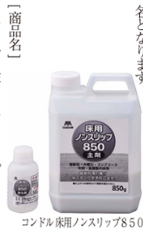
「商品名」 コンドル 床用ノンスリップ850

今回は、コンドルシリーズの新製品である、「コンドル床用ノンスリップ850」のご紹介です。 ※コンドルとは、当社清掃用品のブランド名となります。