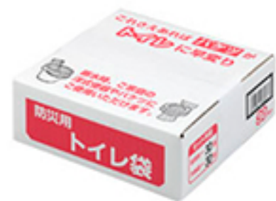
R-47防災用トイレ袋30回分パッケージ

続きまして2つ目は「R-47 防災用トイレ袋」でございます。こちらは組み立て式のトイレではなく、排泄をす