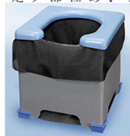
R-39非常用簡易トイレ組立時

少しいずれも不安を取り除くことができれば非常に幸いです。 それでは当社で販売しております防災商品の中から人気商品をピックアップしてご紹介させていただきます。 まず1つ目は「R-39 非常用簡易トイレ」でございます。商品本体は紙を使用しており、便座部分はプラスチックとなっております。トイレ全体がダンボールで出来ている商品が多数ありますが、当社の商品は便座部分がプラスチックであるため、安定感の面や実際のトイレとの差が非常に少なく、評価いただいております。また、脚キャップ付きですので安定性があり、床を傷つけないメリットもでございます。耐荷重は120kgとなっております。ほとんどの方が座っても潰れずに安心して排泄することが出来ます。商品の中には、トイレ本体と合わせて、排泄をする汚物袋と水分を固める凝固剤を5個ずつ、排泄時の目隠しとして頭から被るポンチョをセットしております。組み立てると30×31×32cmの商品サイズになっており、収納する際には約9cmの厚みになります。持ち運びにも困らずに、いざとなったときに使用できる商品となっております。こちらの商品は1月17日放送の「めざましテレビ」にてご紹介いただき、注目されてきている商品でもあり、非常におすすめの商品でございます！ 続きまして2つ目は「R-47 防災用トイレ袋」でございます。こちらは組み立て式のトイレではなく、排泄をす